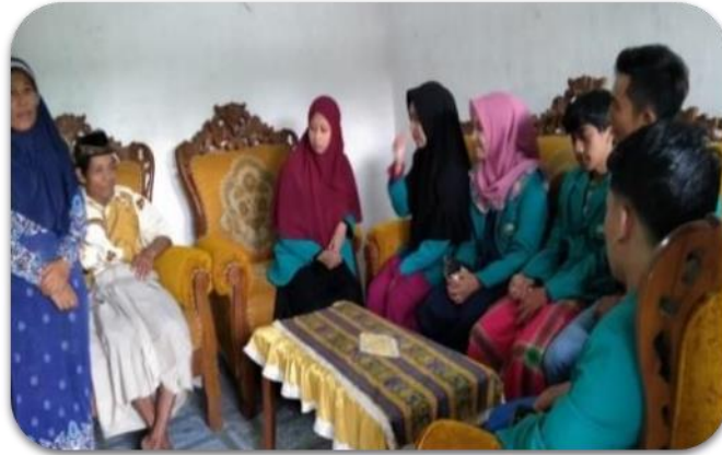
Gambar 2. Silaturahmi dan konsultasi publik untuk menyerap aspirasi masyarakat

Pada tahapan identifikasi permasalahan di lapangan menggunakan metode Survei (Morrison, 2012) dan penentuan responden secara purposive, yaitu dengan menentukan responden berdasarkan pertimbangan tertentu yang dinilai dapat memenuhi tujuan survei (Morrison, 2012) (Nizar, 2011).