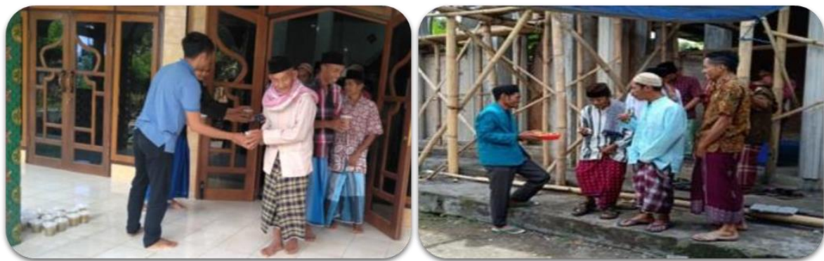
Gambar 4. Kegiatan Jum’at Bersedekah berbasis Masjid oleh mahasiswa KKN-PPM Tematik

Sedekah di hari jum’at yang berbasis masjid ini dilakukan sebagai salah satu bentuk pemberdayaan masyarakat, dengan harapan agar masyarakat dusun Mulyoasri, Desa Mulyoasri dapat meningkatkan solidaritas sosial melalui sedekah di hari jumat (Gambar 4). Kegiatan sedekah hari jum’at ini dilakukan selama 3 jum’at berturut-turut selama kegiatan KKN-PPM berlangsung, yang dilakukan pada 3 masjid yang ada pada pedukuhan Mulyoasri.