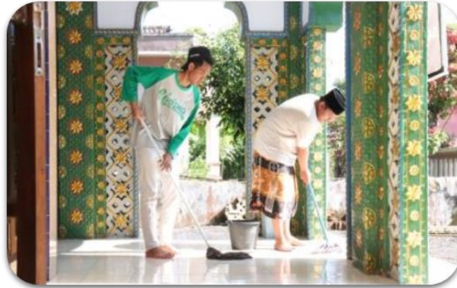
Gambar 7. Pembersihan Masjid setiap jum'at pagi bersama masyarakat

Untuk memperkuat program unggulan berbasis Masjid, maka dilaksanakan program tambahan yaitu kajian Islam Aswaja sebagai salah satu langkah untuk lebih memakmurkan Masjid, kegiatan ini bertujuan untuk memperkuat dan memberi pengetahuan yang baru untuk masyarakat yang ada di Desa Mulyoasri agar mampu mengembangkan masjid sebagai pusat peradaban masyarakat. Adapun yang menjadi narasumber pada kegiatan penyuluhan adalah Kukuh Santoso yang merupakan dosen Fakultas Agama Islam sekaligus Takmir Masjid Ainul Yaqin Universitas Islam Malang (Gambar 8).