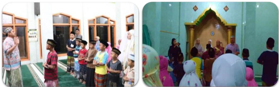
Gambar 3. Pelatihan tata cara sholat lima waktu yang baik dan benar kepada anak-anak

Menurut Hermawan (2018), usia dini merupakan usia emas atau the golden age. Pada fase ini anak dapat menyerap semua pengetahuan yang didapat pada lingkungan sekitar dengan maksimal. Pada usia ini penanaman nilai-nilai keagamaan haruslah dilakukan secara terus-menerus, sehingga akan menjadi kebiasaan anak.