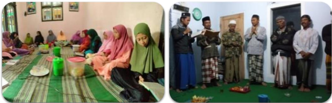
Gambar 9. Berbagai kegiatan pendukung mahasiswa KKN-PPM Tematik berbasis Masjid yang disinergikan dengan kegiatan rutin masyarakat

Tiga kegiatan masyarakat yang disinergikan dengan kegiatan pemberdayaan mahasiswa KKN-PPM Tematik berbasis Masjid adalah Tahlilan, Asyrokalan, Diba'an (Gambar 9). Keikutsertaan Mahasiswa KKN-PPM dalam rutinitas amaliah yang dijalankan oleh masyarakat ini memiliki dua tujuan, yaitu: 1) media sosialisasi mahasiswa dengan masyarakat untuk meningkatkan hablum minannas , dan 2) media untuk turut serta meningkatkan partisipasi masyarakat dalam kegiatan dimaksud sebagai manifestasi peningkatan silaturahmi antar warga masyarakat dan upaya mempertahankan tradisi kaum Nahdliyin yang sudah dicontohkan oleh para ulama terdahulu. Upaya ini dilaksanakan dalam rangka membentengi masyarakat di tengah masuknya paham-paham yang membawa ide pemurnian Islam (kembali ke Al-Qur'an dan hadist), dan sangat masif tersebar di Indonesia. Umumnya kelompok-kelompok Islam ekstrim ini selalu menganggap amaliah-amaliah kaum Nahdliyin ini bid'ah dan tidak memiliki dalil.