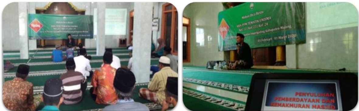
Gambar 8. Kegiatan Pendukung untuk peningkatan kemakmuran Masjid

Untuk memperkuat program unggulan berbasis Masjid, maka dilaksanakan program tambahan yaitu kajian Islam Aswaja sebagai salah satu langkah untuk lebih memakmurkan Masjid, kegiatan ini bertujuan untuk memperkuat dan memberi pengetahuan yang baru untuk masyarakat yang ada di Desa Mulyoasri agar mampu mengembangkan masjid sebagai pusat peradaban masyarakat. Adapun yang menjadi narasumber pada kegiatan penyuluhan adalah Kukuh Santoso yang merupakan dosen Fakultas Agama Islam sekaligus Takmir Masjid Ainul Yaqin Universitas Islam Malang (Gambar 8).