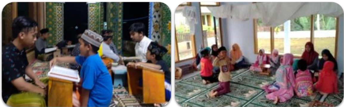
Gambar 5. Belajar Mengaji bagi Anak-anak usia dini berbasis Masjid

Mengajar membaca Al-Qur’an (Gambar 5) dijalankan sebagai program pendukung, untuk memperkuat program unggulan terutama pelatihan sholat lima waktu. Dengan pendidikan al-Qur’an sejak dini, fitrah suci anak niscaya dapat dilestarikan dengan baik. Sedangkan menurut Astuti & Aziz (2019), kehanifan anak di sektor keberagamannya akan eksis dengan kitab suci, sehingga jika konsep pendidikan Al-Qur’an ditanamkan sejak kecil, maka dapat dijadikan sebagai tonggak utama terbentuknya mental dan kepribadian anak sehat untuk menstimulasi pengembangan potensi anak.