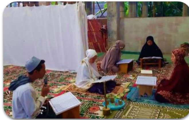
Gambar 6. Kegiatan Khotmil Qur’an Setiap selesai Shloot subuh bersama masyarakat

Banyak keutamaan membaca ayat Al-Qur’an, menurut Rasikh (2019), membaca Al-Qur’an termasuk ibadah paling utama di antara ibadah-ibadah yang lain, sebagaimana yang diriwayatkan oleh an-Nu‘man ibn Basyir: Rasulullah shallahu ‘alaihi wasallam bersabda, “Sebaik-baiknya ibadah umatku adalah membaca Al-Qur’an.” (HR. al-Baihaqi).